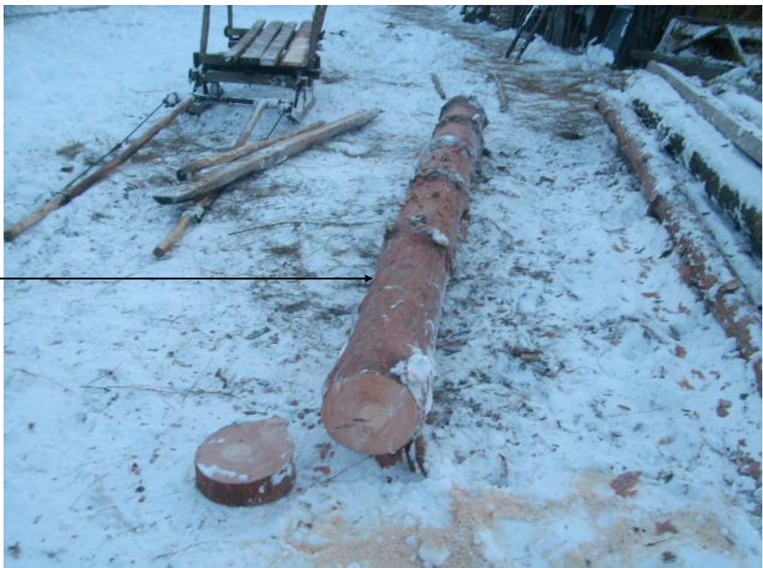
Рис. 4. Колода деревини породи „сосна сироростуча” виявлена під час огляду території домогосподарства гр. Масюк Є.І.

В подальшому при огляді місця події експертом було, виявлено сліди від коліс кінної підводи, по яких слідчо-оперативна група вийшли до території домогосподарства гр. Масюк Єви Іванівни, що розташоване в Любешівському р-ні, с. Залізниця, вул. Золотаренка 18. Під час огляду домогосподарства гр. Масюк Є.І., було виявлено одну колоду деревини породи „сосна сироростуча”, з якої також було зроблено зріз.