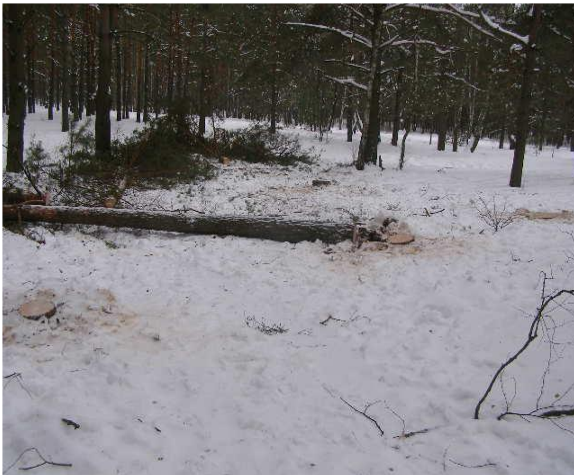
Рис. 1. Місце незаконної порубки лісу.