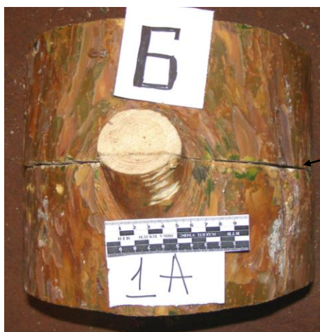
Рис. 5. Загальний вигляд лінії розділення досліджуваних зрізів.