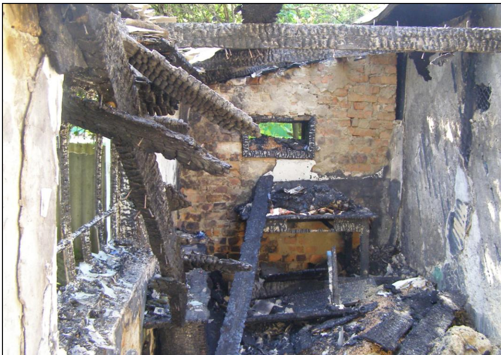
Рис. 3. Сліди дії вогню в приміщенні веранди (осередку пожежі).

По результатам огляду місця пожежі спеціаліст-вибухотехнік попередньо визначив розташування осередку пожежі, джерело запалювання та ймовірну причину виникнення пожежі – занесення стороннього запалювання.